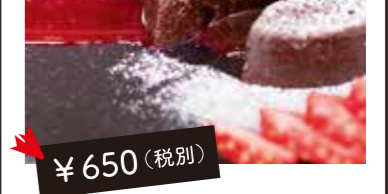
1 フォンダンショコラ (コーヒー又は紅茶セット) ¥650(税別)