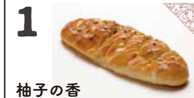
1 柚子の香 柚子を生地に練り込み、小豆のかご豆を包んで焼き上げた爽やか風味のお豆パンです。 ●エネルギー:280kcal/個 ●アレルギー:小麦 ¥150(税別)