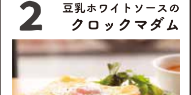
2 豆乳ホワイトソースのクロックマダム (サラダ・スープセット) ¥700(税別)