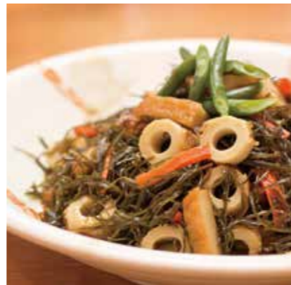
切り昆布の煮物 エネルギー:145kcal/100g・アレルギー:卵・小麦