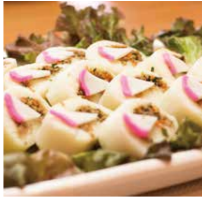
じゃがいもの博多蒸し エネルギー:104kcal/100g・アレルギー:小麦