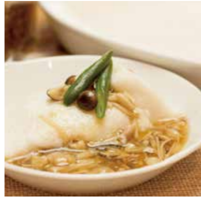
白身魚のとろろ蒸し エネルギー:294kcal/100g・アレルギー:卵・小麦