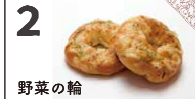
2 野菜の輪 ごぼう、玉葱、トマト、アーモンドを生地に練り込み、アレルギーフリーのドレッシングをトッピングしてふっくら焼き上げた野菜パンです。 ●エネルギー:204kcal/個 ●アレルギー:小麦 ¥120(税別)