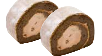
1 米粉ロール トリプルショコラ ●カット ¥380(税別) ●エネルギー:428kcal/個 ●アレルギー:卵・乳 ●半分 ¥900(税別) ●1本 ¥1,700(税別)