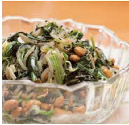
黒ごま納豆和え エネルギー:62kcal/100g・アレルギー:小麦