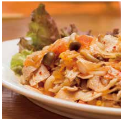
豚キムチマリネ エネルギー:162kcal/100g・アレルギー:えび