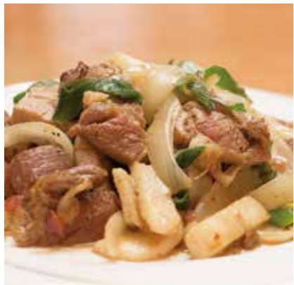
豚肉のソテー梅風味 エネルギー:175kcal/100g・アレルギー:小麦