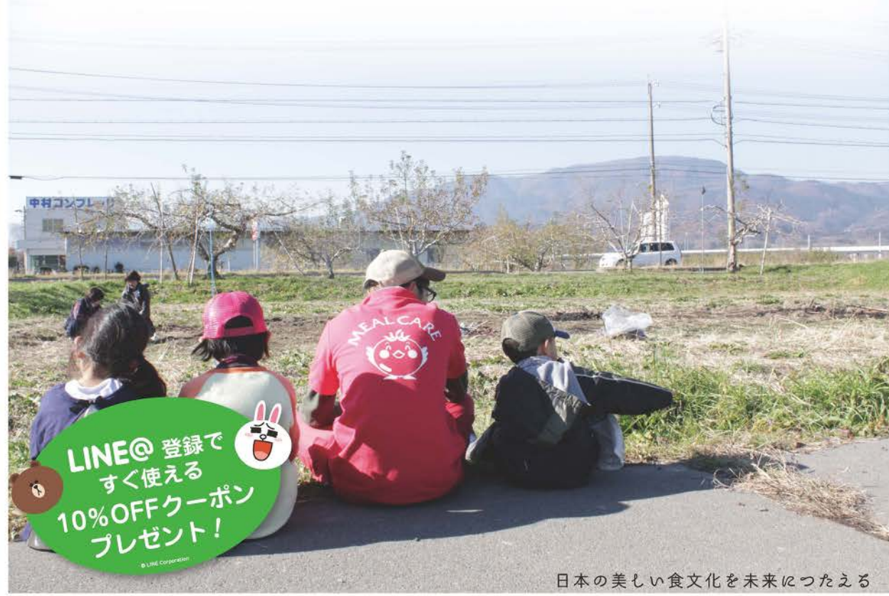
日本の美しい食文化を未来につたえる