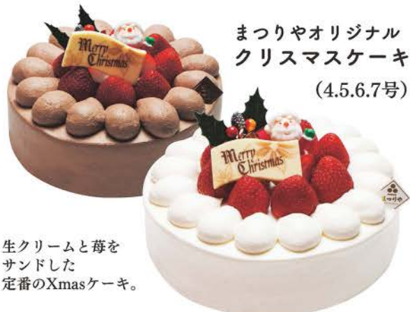
まつりやオリジナル クリスマスケーキ (4.5.6.7号)